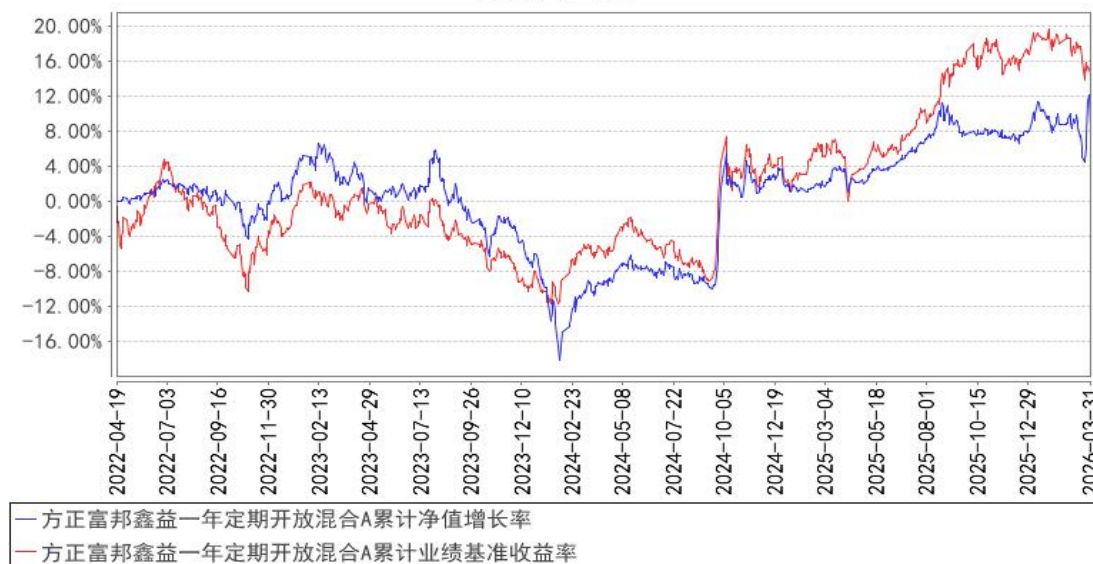
方正富邦鑫益一年定期开放混合A累计净值增长率与同期业绩比较基准收益率的历史走势对比图