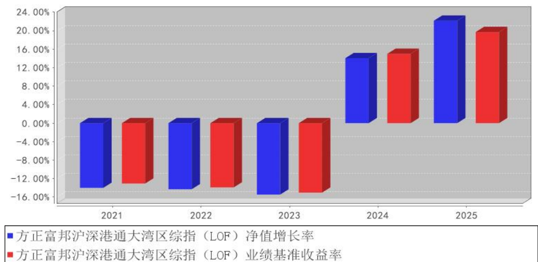
方正富邦沪深港通大湾区综指（LOF）基金每年净值增长率与同期业绩比较基准收益率的对比图