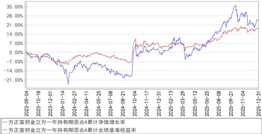
方正富邦金立方一年持有期混合A累计净值增长率与同期业绩比较基准收益率的历史走势对比图