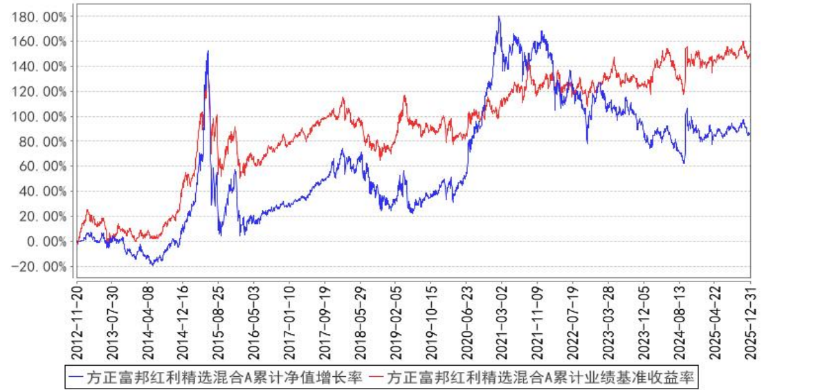
方正富邦红利精选混合A累计净值增长率与同期业绩比较基准收益率的历史走势对比图