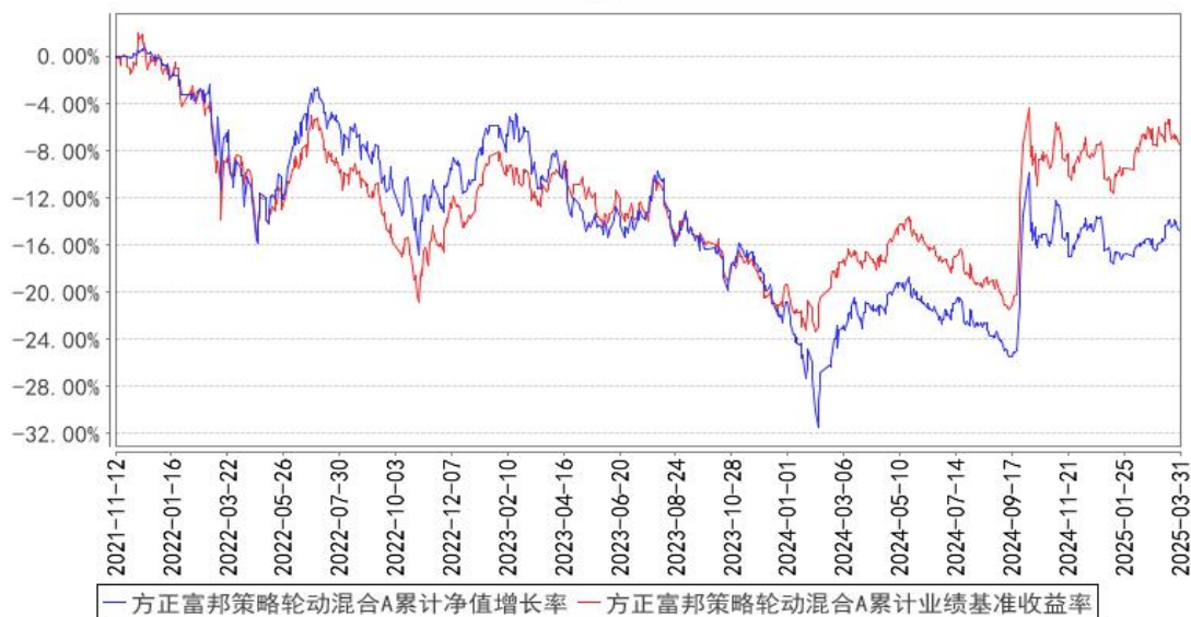
方正富邦策略轮动混合A累计净值增长率与同期业绩比较基准收益率的历史走势对比图